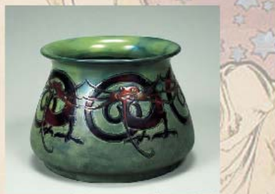
「ハンガリーの陶器(鉢)」京都高等工芸学校図画資料の標本・標本として購入・収集された陶器