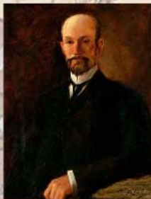
「中津岩太博士像」横井 定 1903年京都高等工芸学校創設代校長