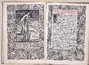
「ケルムスコット・プレス設立主像(巻頭見開)」 ウィリアム・モリス 著 1838年

美術工芸資料館は1980年学内共同教育研究施設として設立され、本学前身の京都高等工芸学校創設時(1902年)から教材として収集してきた資料を所蔵し、所蔵資料について教育研究を行い、さらに展示を目的とする施設です。