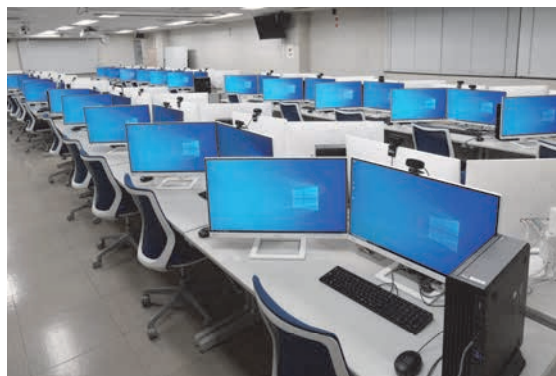
図2 情報科学センター演習室