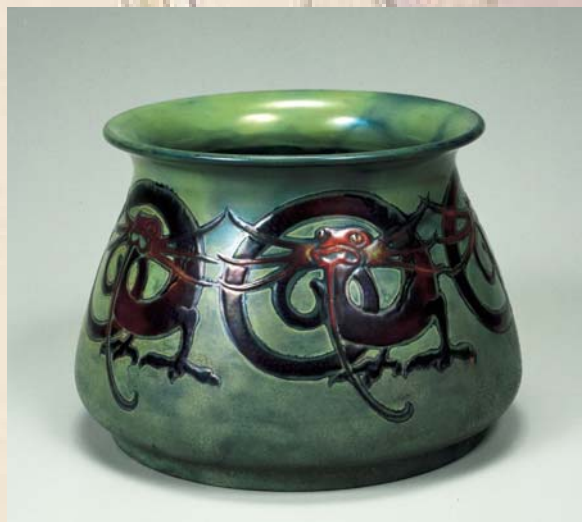
「ハンガリーの陶器(鉢)」京都高等工芸学校図案科の教材・標本として購入・収集された陶器