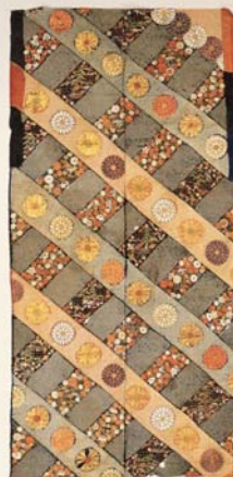
「匹田縫(裂)、菊松竹梅 に宝尽くし縫: 黒地斜格子に菊模様小袖裂」