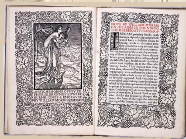
「ケルムスコット・プレス設立主意書(巻頭見開)」 ウィリアム・モリス 著 1898年

美術工芸資料館は1980年学内共同教育研究施設として設立され、本学前身の京都高等工芸学校創設時(1902年)から教材として収集してきた資料を所蔵し、所蔵資料について教育研究を行い、さらに展示を目的とする施設です。