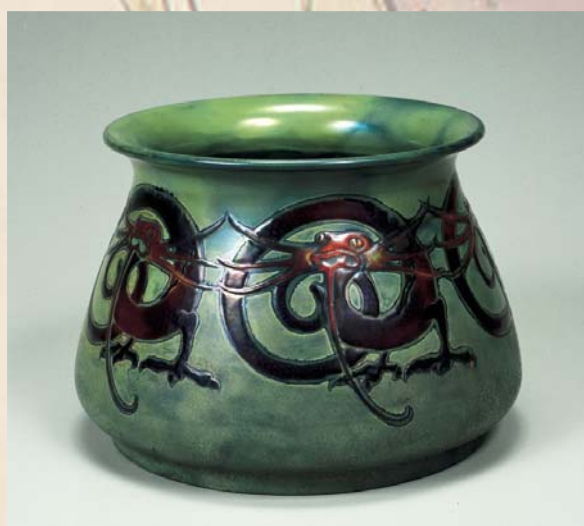
「ハンガリーの陶器(鉢)」京都高等工芸学校図案科の教材・標本として購入・収集された陶器