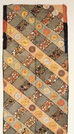
「匹田縫(裂)、菊松竹梅 に宝尽くし縫: 黒地斜格子に菊模様小袖裂」