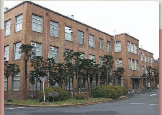
現在の2号館(工芸本館)

ところで、吉田の学舎が手狭になったのか、それとも京都大学が手狭になって、校地を拡張するために余儀なく高等工芸学校は移転することになった。詳しい処は知らないが、とにかく、当時で言う「愛宕郡松ヶ崎村」への引越しである。それで、新校舎が造られることになり、その設計図が今回採り上げる主たる資料である。この図には平面図だけで、立面図も断面図は描かれていない。それらが別に作成された形跡もない。おそらく本省関係者へのプレゼンテーション用のものと想像する。従って着彩の理由も納得できると言うものである。昭和5、6年の話ではある。