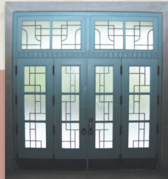
2号館(工芸本館)正面玄関

ばかりの現京都工芸繊維大学工芸学部の前身であり、第三高等工業学校を目して明治35(1902)年に開設した国の直轄学校なのであった。あれこれの経緯は措くとして、とにかく今で言う左京区吉田の地に構えられた学校である。吉田と言っても広い。日伊会館、人文科学研究所、関西日仏学館、京都大学西部講堂、同体育館あたりの一角である。「工織大まりこうじ会館(国際交流会館)」があるのは往時あのあたりに高等工芸学校が存在した事の名残り以外の何ものでもない。