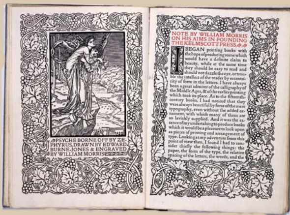
「ケルムスコット・プレス設立主意書(巻頭見開)」 ウィリアム・モリス 著 1898年

美術工芸資料館は1980年学内共同教育研究施設として設立され、本学前身の京都高等工芸学校創設時(1902年)から教材として収集してきた資料を所蔵し、所蔵資料について教育研究を行い、さらに展示を目的とする施設です。